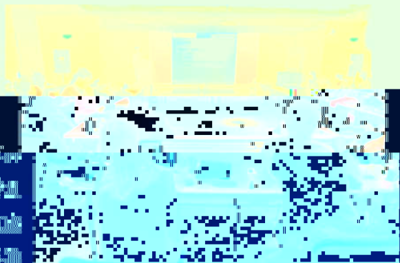
教育学院2010年度学术交流会现场

展望未来, 把握机遇, 开拓创新, 发展研究, 提高学术影响力, 教育战线上, 同仁们必将戮力同心, 同舟共济, 为教育事业的繁荣和发展做出更大的贡献。交流会上, 与会同仁畅所欲言, 气氛热烈, 大家就教育研究现状、热点问题、学术动态、学科建设、人才培养、学术交流等方面进行了广泛而深入的交流, 达成了许多共识, 为今后进一步开展合作奠定了良好的基础。